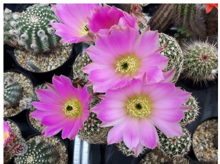
Echinocereus adusruts ssp. Keizerae